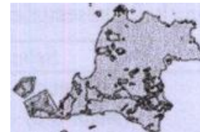
Gambar 1 Kesesuaian habitat badak jawa ( Rhinoceros sondaicus Desmarest 1822) di TNUK

Sumber foto: Peta Kawasan Taman Nasional Ujung Kulon